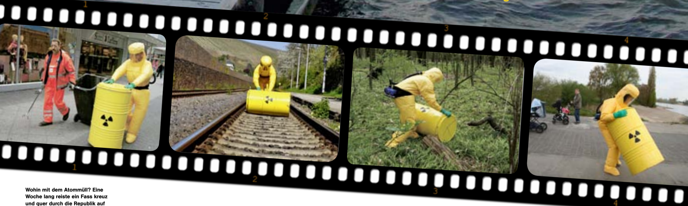
Wohin mit dem Atommüll? Eine Woche lang reiste ein Fass kreuz und quer durch die Republik auf der Suche nach einem Endlager. Eine ENTEGA-Aktion zum traurigen Jahrestag von Tschernobyl.

Atomkraft ist hochriskant, die Frage nach dem Endlager für den Strahlenmüll ohne Antwort. Höchste Zeit, das Bewusstsein für die Gefahren neu zu schärfen, statt die Laufzeiten zu verlängern.