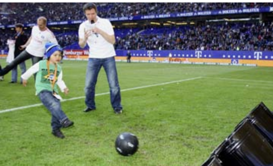
Volltreffer für den Klimaschutz: Beim Torwandschießen gab es keine Chance für CO 2 .

Wer wissen will, wie groß sein eigener CO 2 -Fußabdruck ist: einfach nachmessen unter www.entega.de/co2check .